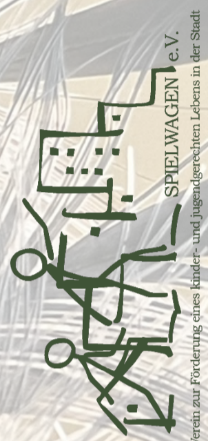
Verein zur Förderung eines kinder- und jugendgerechten Lebens in der Stadt